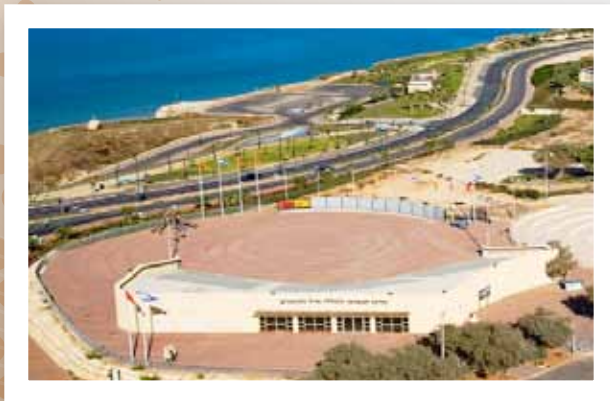
מרכז ההנצחה-מבט על