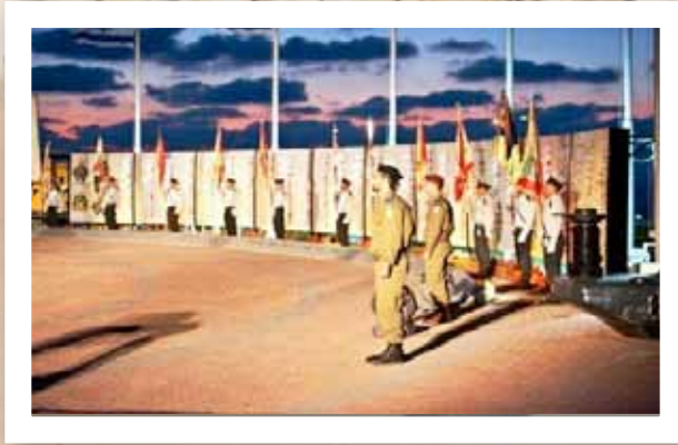
טכס התייחדות עם חללי חיל החימוש