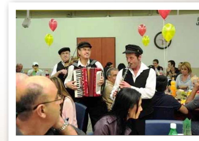
הדלקת נר חנוכה

אחת לשנה, מוזמנים החיילים הבודדים מטעם העמותה ליום כיף המאופיין בפעילות רחבה בארוחה עשירה, במשחקים, ברחצה בבריכה ובמתן שי לכל אחד מהם